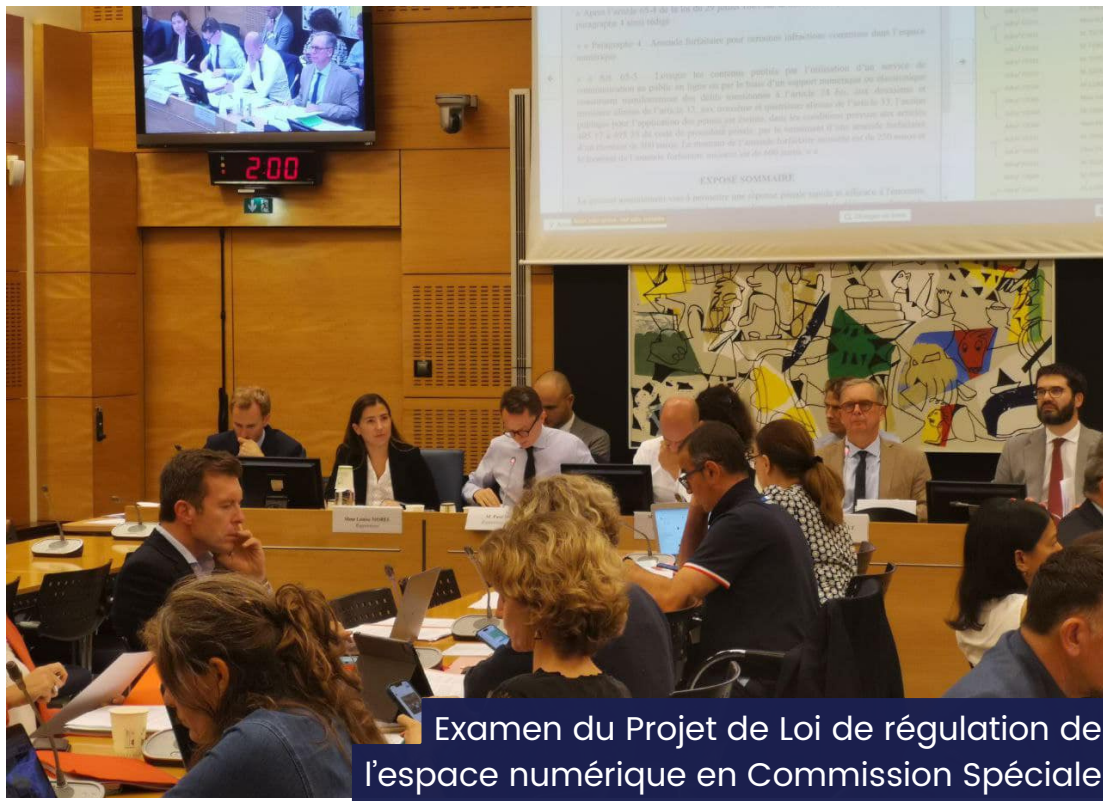
Examen du Projet de Loi de régulation de l'espace numérique en Commission Spéciale