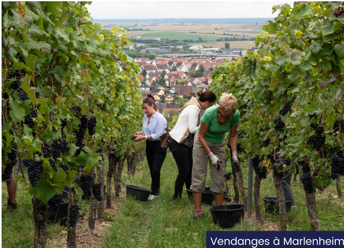
Vendanges à Marlenheim