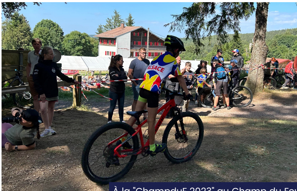
À la "ChampduF 2023" au Champ du Feu

Pour vous inscrire à ma lettre d'information, contactez- nous à :