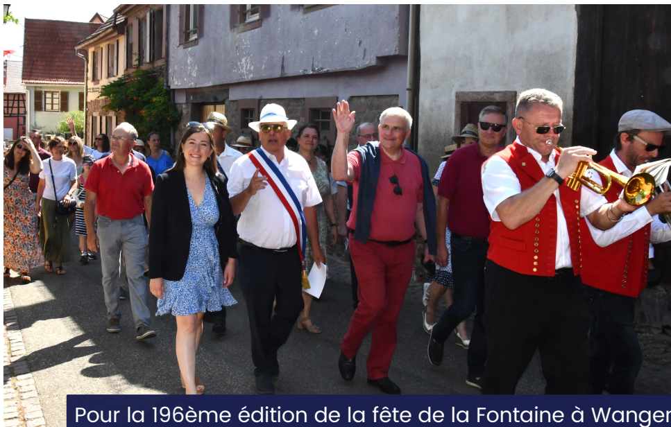
Pour la 196ème édition de la fête de la Fontaine à Wangen