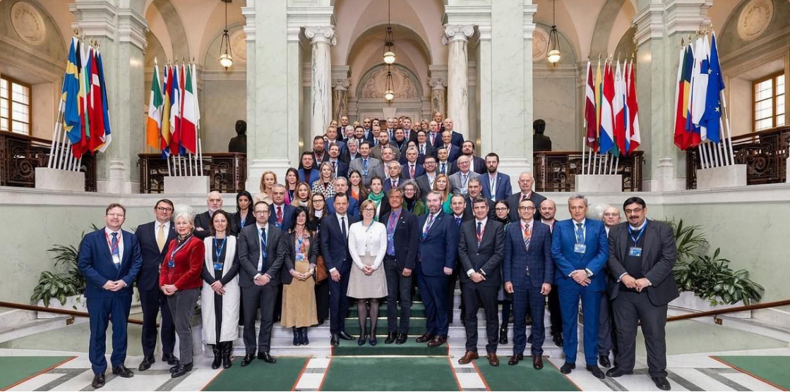
Stockholm : réunion des parlementaires européens autour d'Europol